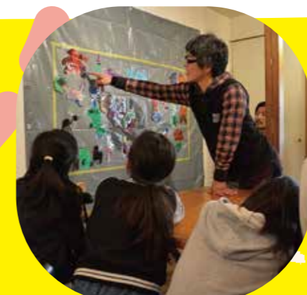
切り絵とコラージュ「誰でもマティス」