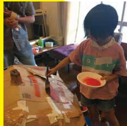
立体制作「みんなでもうひとつ国立競技場を作ろう！」