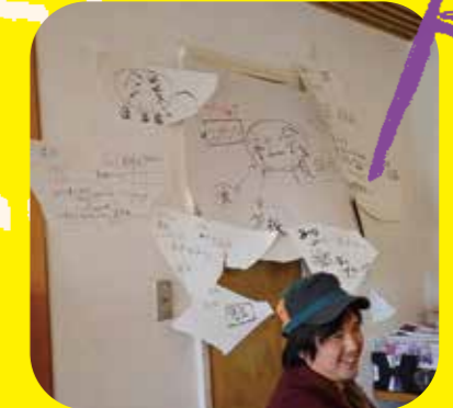
おしゃべり「社会について考える」