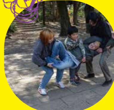
お散歩「体を使い人に見せる」