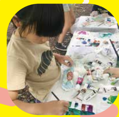
粘土に着色「あたらしい化石をつくる」